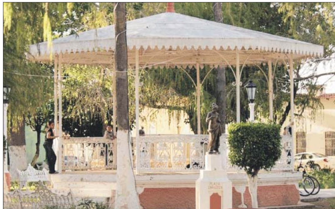
Este quiosco está en el centro de la Plaza de Armas y es uno de los símbolos del lugar.