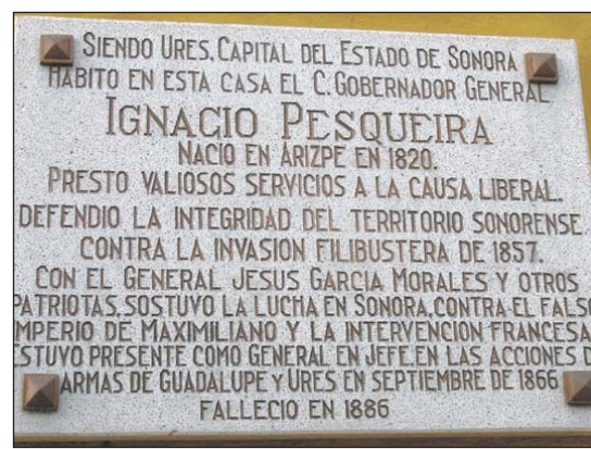
Los urenses se pueden jactar de haber tenido de huésped al general Ignacio Pesqueira.

esta región con los constantes levantamientos y rebeliones de la tribu yaqui en el siglo pasado y principios del presente.