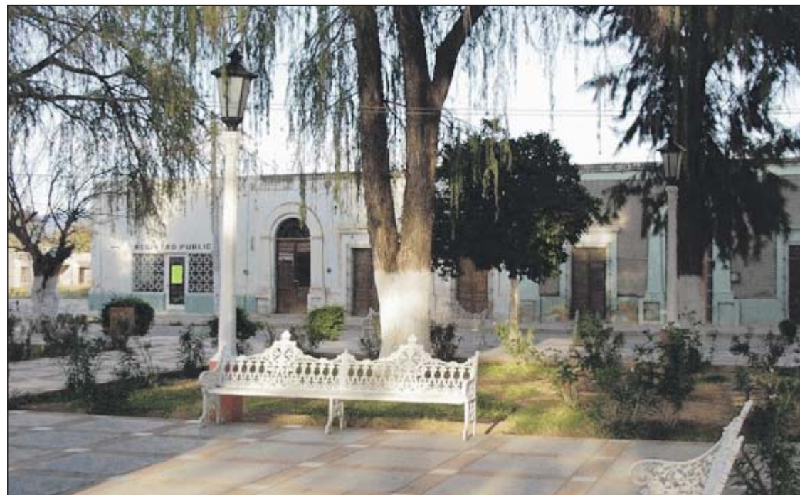
La Plaza de Armas sirve a las familias del lugar para pasar un rato agradable, después de misa.