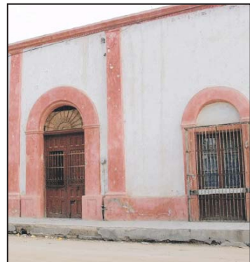
Las grandes casonas, con amplias puertas, es lo común.