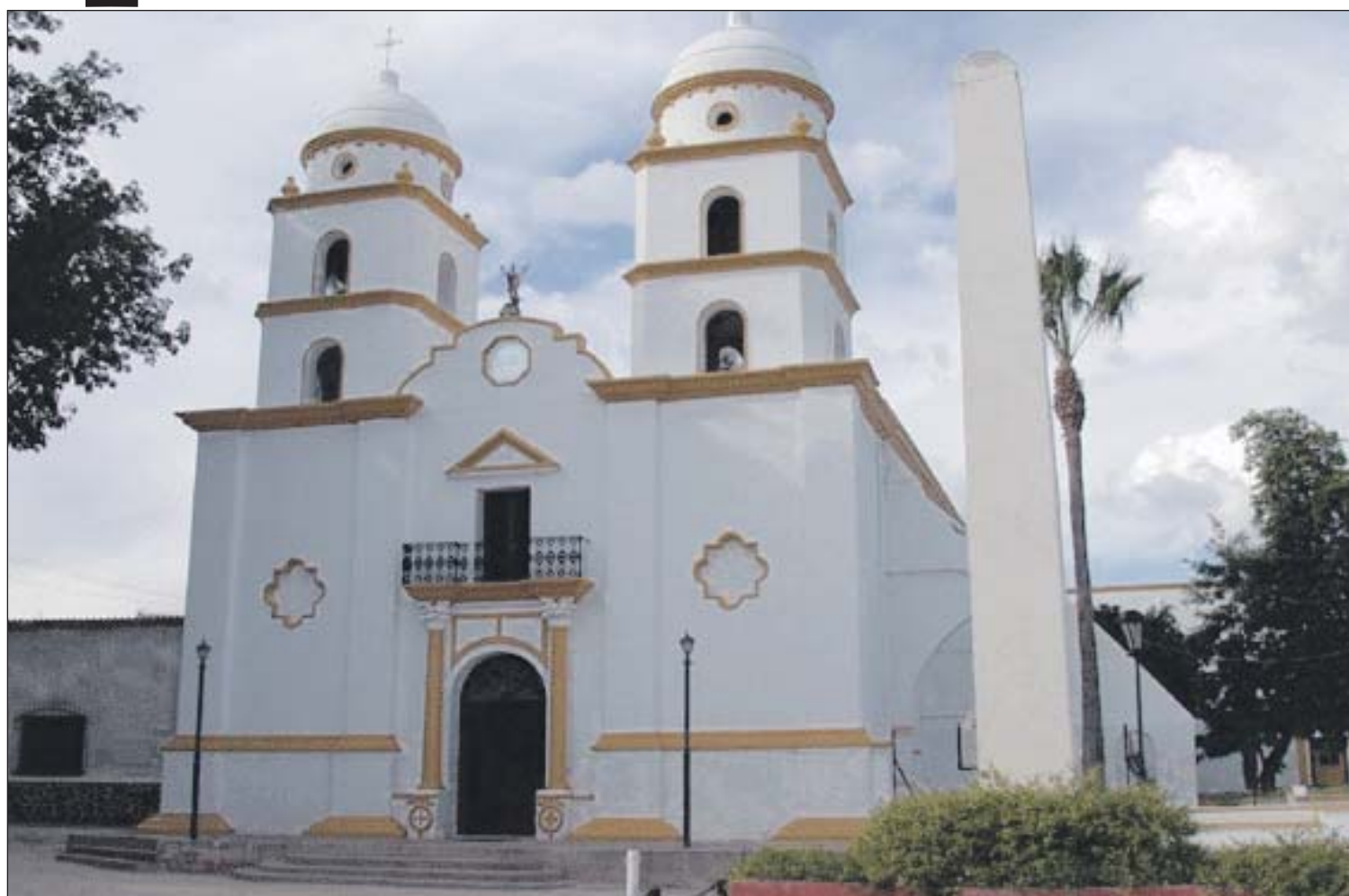
La iglesia y misión de San Ángel es el punto central de esta localidad, donde se puede disfrutar de un ambiente tranquilo y campirano.

Situación similar tuvieron que enfrentar pobladores de