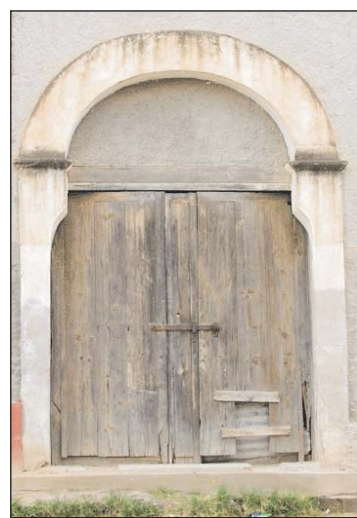
Viejos y pesados portones de madera son típicos en Ures.