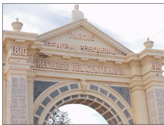
Este es el arco conmemorativo de la Independencia Nacional, que se conserva en buen estado.

¿CÓMO SE DICE... VERTER O VERTIR? Según la Real Academia Española lo correcto es verter, que significa derramar o vaciar líquidos.