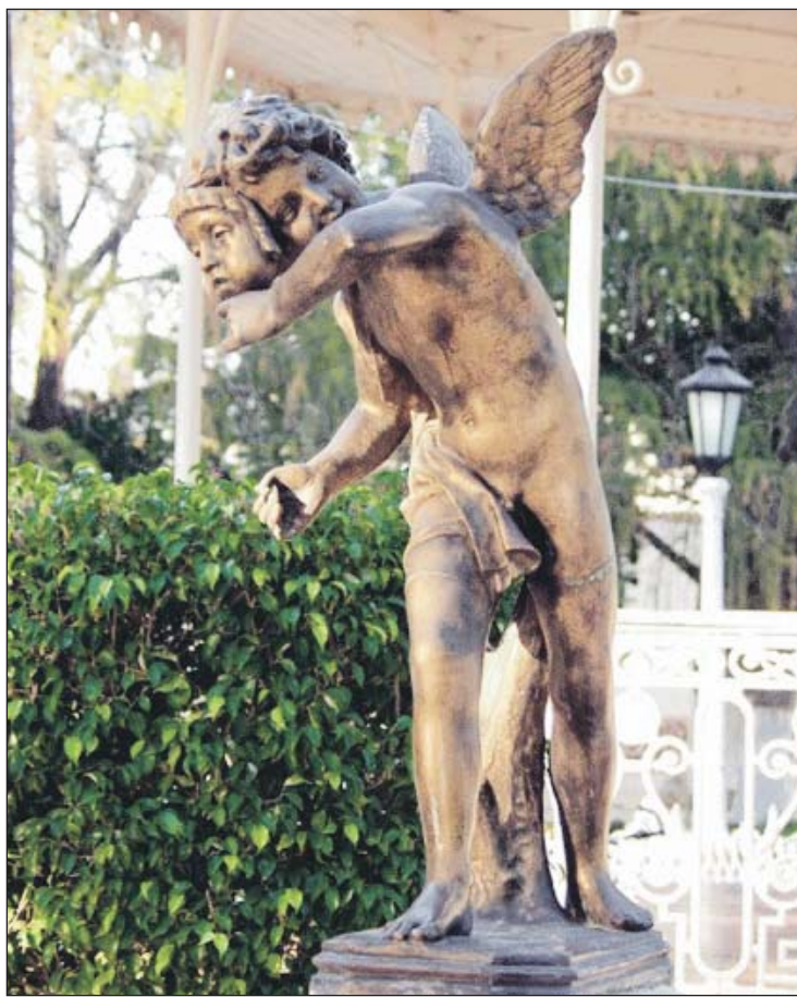
En la Plaza de Armas puede encontrarse este querubín.