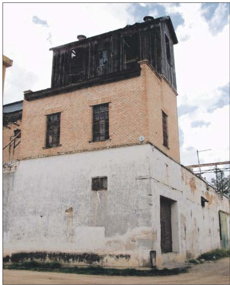
Esta edificación de tres pisos es muy antigua y peculiar.