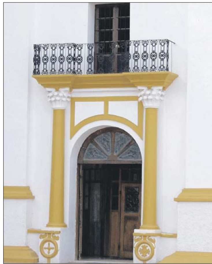
Una arquitectura original es la iglesia de San Ángel.